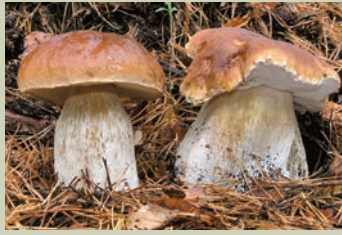
Boletus ( Boletus edulis ).

En el Coto Micológico de LA PEDRIZA-HOYA DE SAN BLAS (Manzanares El Real y Soto del Real) se encuentran setas como los Boletos ( Boletus edulis , B. aereus ), el Níscalo ( Lactarius