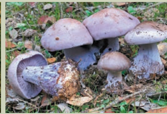
Pie azul ( Lepista nuda ).