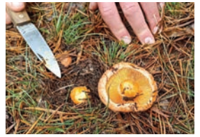
Níscalo. Corta la seta por el tallo sin dañar el micelio.