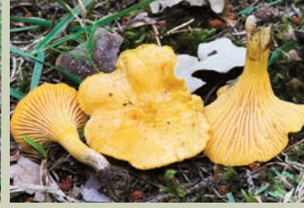
Rebozuelo ( Cantharellus cibarius ).