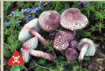
Lepiota ( Lepiota brunneoincarnata ).

deliciosus ), la Seta de cardo ( Pleurotus eryngii ), Rebozuelo ( Cantharellus cibarius ) y Amanita de los césares ( Amanita caesarea ). Además, hay otras especies comestibles como Agaricus , Agrocybe , Calocybe , Higrophorus , Lepista , Macrolepiota , Marasmius . Sin embargo, también existen setas tóxicas como la Oronja verde ( Amanita phalloides ), la Lepiota ( Lepiota brunneoincarnata ) y la Galerina ( Galerina marginata ), que pueden causar intoxicaciones graves.