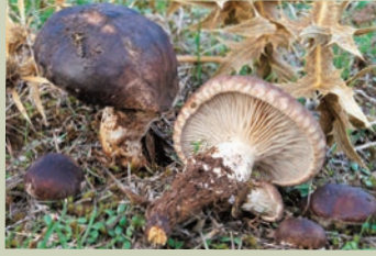
Seta de cardo ( Pleurotus eryngii ).