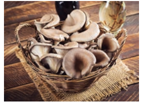
Usar una cesta de mimbre para recolectarlas. Setas de ostra.

Según la especie de que se trate se cortará por la base del pie o extraerlo completo . Además los tamaños mínimos para recolectar también están establecidos . Así las setas del grupo Boletus han de cortarse con un tamaño mínimo de 4 cm de diámetro y el resto de especies de 2 cm.