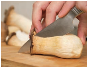
Seta de cardo ( Pleurotus eryngii ) en la cocina.

Los hongos tienen un papel muy importante en los hábitats forestales , pues actúan como reguladores: descomponen la materia orgánica, hacen simbiosis (micorrizas) con los árboles, etc... En definitiva ayudan a que los ecosistemas funcionen.