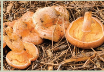
Níscalo ( Lactarius deliciosus ).