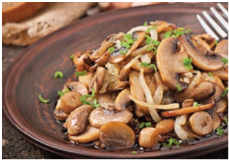
Plato de setas cocinadas.