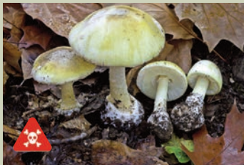
Oronja verde ( Amanita phalloides ).