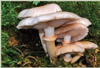
Seta de chozo ( Agrocybe aegerita ).